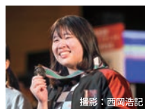
全日本選手権大会で、日本記録を樹立