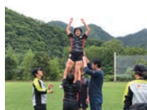
競技団体のコース選抜や育成・強化選手に選出